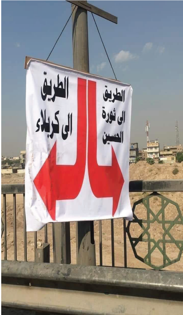
الشكل رقم (1)