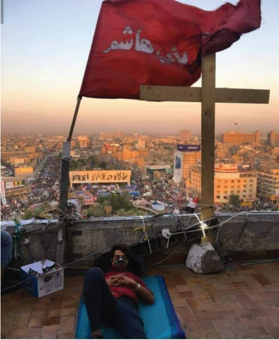
الشكل رقم (3)